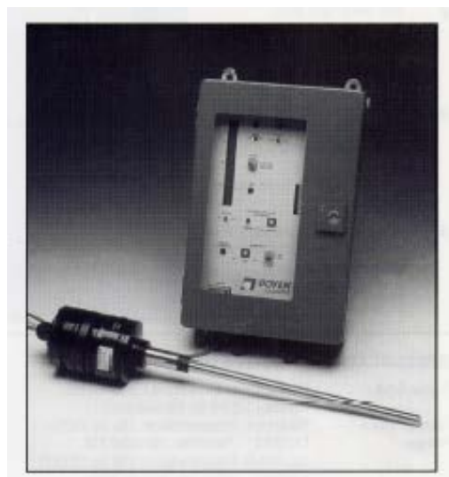
バグフィルター破損検出器