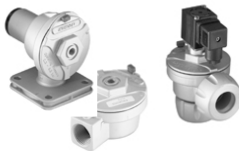
ダイアフラムと パイロットバルブ